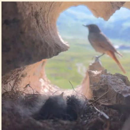
Bilder: Monica Bill