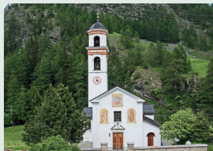
Baselgia s. Francestg, Mulegns